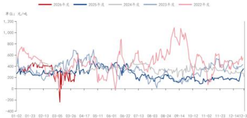
PTA: 加工费: 中国 (日)