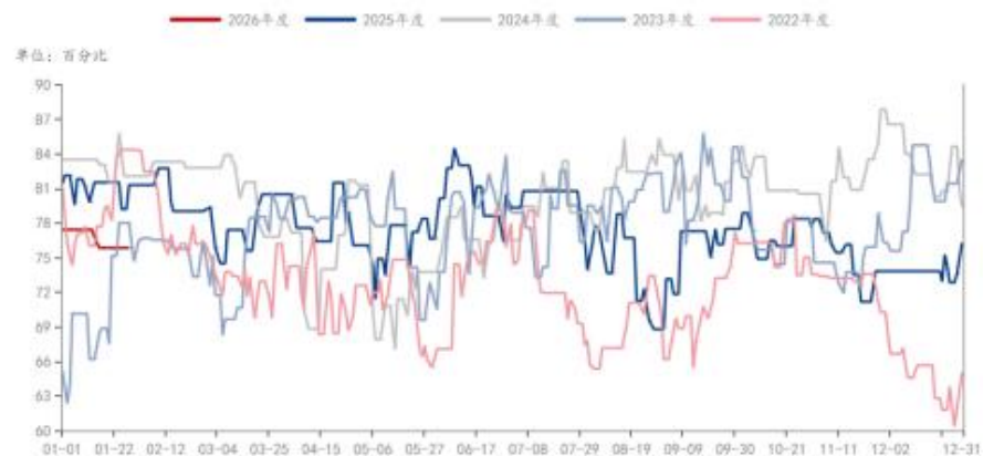
PTA: 产能利用率: 中国 (日)