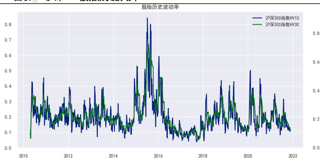
图表 3：沪深 300 股指历史波动率