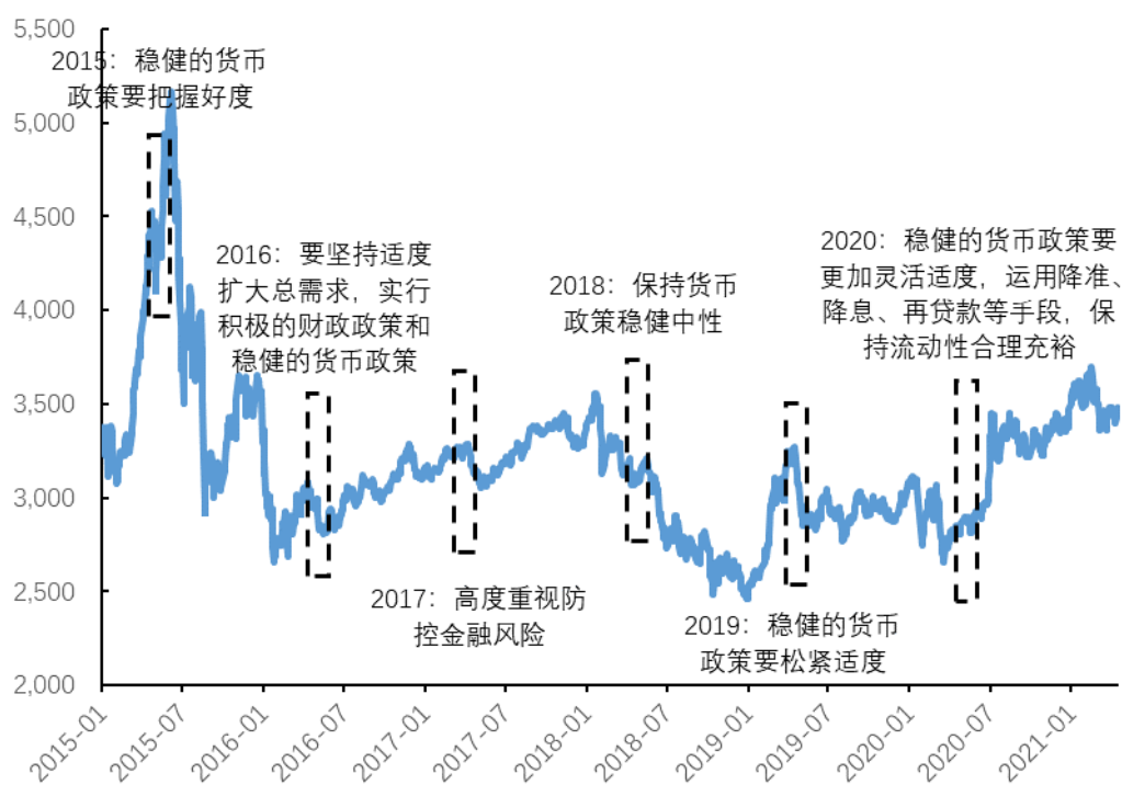
图 1: 历届四月政治局会议对市场走势的影响

(6) 2020 年政治局会议肯定“我国经济展现出巨大韧性，复工复产正在逐步接近或达到正常水平”，指出“当前经济发展面临的挑战前所未有”，强调“稳健的货币政策要更加灵活适度，运用降准、降息、再贷款等手段，保持流动性合理充裕”。宽松的货政策背景下，疫情后的股市企稳回升。